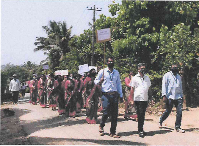
Jatha moving in the Streets of Kowdalli, 27-03-2021