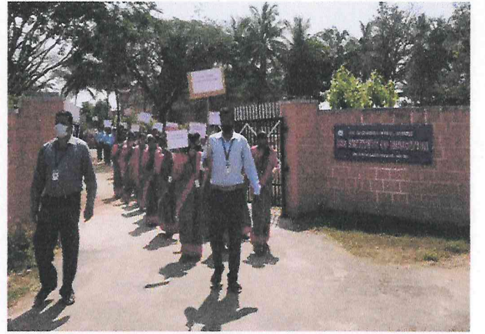
Start of Covid-19 Awareness Jatha, 27-03-2021