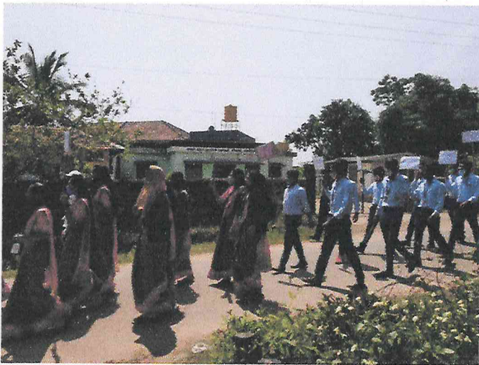
Jatha Moving in the Streets of Kowdalli, 27-03-2021