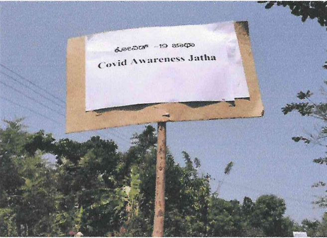
"Covid - 19 Awareness Jatha", 27-03-2021

ಕರೋನ ವೈರಾಣುಗಳು ಜೈವಿಕ ಬಾಂಬ್ ರೀತಿ ಕಾರ್ಯನಿರ್ವಹಿಸುತ್ತಿದ್ದು ಯುದ್ಧಕ್ಕಿಂತ ಭೀಕರವಾದ ಪರಿಣಾಮವನ್ನೇ ಉಂಟುಮಾಡುತ್ತಿತ್ತು. ಯುದ್ಧಗಳಲ್ಲಿ ಸೈನಿಕರು ಶತ್ರು ಸೈನಿಕರನ್ನು ಬಡಿದು ಹೋಡಿಸಲು ಹಗಲು-ರಾತ್ರಿ ಹೋರಾಡಿ ದೇಶದ ಸುರಕ್ಷತೆಗೆ ಶ್ರಮಿಸುವರು. ಕರೋನ ವೈರಾಣುಗಳಿಂದ ತಪ್ಪಿಸಿಕೊಳ್ಳಲು ಜನರು ಸೈನಿಕರಷ್ಟು ಹಗಲು-ರಾತ್ರಿ ಕಷ್ಟಪಡಬೇಕಾಗಿಲ್ಲ. ಬದಲಾಗಿ ಜನರೆಲ್ಲರೂ ತಮ್ಮ ತಮ್ಮ ಮನೆಯಲ್ಲಿಯೇ ಇದ್ದು, ಅಗತ್ಯವಿದ್ದಲ್ಲಿ ಮಾತ್ರ ಮನೆಯಿಂದ ಹೊರಬಂದು, ಸಾಮಾಜಿಕ ಮತ್ತು ದೈಹಿಕ ಅಂತರವನ್ನು ಕಾಯ್ದುಕೊಂಡು, ಸರ್ಕಾರ ಮತ್ತು ತಜ್ಞರು ನೀಡುವ ಸೂಚನೆಗಳನ್ನು ಕಟ್ಟುನಿಟ್ಟಾಗಿ ಪಾಲಿಸುತ್ತಾ ಹೋದರೆ ಈ ಒಂದು ಕರೋನ ವೈರಾಣುಗಳನ್ನು ಹಿಮ್ಮೆಟ್ಟಿಸುವ ಯುದ್ಧದಲ್ಲಿ ಜಯ ಸಾಧಿಸಬಹುದು. ಇದೇ ಜನರು ದೇಶಕ್ಕೆ ಸಲ್ಲಿಸಬಹುದಾದ ನಿಜವಾದ ಸೇವೆಯಲ್ಲವೇ? ಇಲ್ಲವಾದಲ್ಲಿ, ಸಂಪೂರ್ಣ ರಾಜ್ಯ, ಅಷ್ಟೇ ಯಾಕೆ? ಇಡೀ ದೇಶವನ್ನೇ ಆವರಿಸಿ ಎಲ್ಲರನ್ನೂ ಬಲಿತೆಗೆದುಕೊಳ್ಳುವುದು ಅಕ್ಷರಶಃ ಸತ್ಯ. 'ಲಾಕ್ ಡೌನ್' ಅನ್ನು ಯಥಾವತ್ತಾಗಿ ಮುಂದುವರೆಸಿದರೂ ಆಶ್ಚರ್ಯವೇನಿಲ್ಲ. ಎಲ್ಲಿಯವರೆಗೆ ನೂರಕ್ಕೆ ನೂರರಷ್ಟು ಜನ ಮುನ್ನೆಚ್ಚರಿಕೆ ಕ್ರಮಗಳನ್ನು ಅನುಸರಿಸದೇ, ಸರ್ಕಾರದ ಸೂಚನೆಗಳನ್ನು ಕಟ್ಟುನಿಟ್ಟಾಗಿ ಪಾಲಿಸದೇ, ಬೇಜವಾಬ್ದಾರಿ ಮತ್ತು ನಿರ್ಲಕ್ಷ್ಯತೆಯನ್ನು ತೋರುವರೋ, ಅಲ್ಲಿಯವರೆಗೂ ಜನರು ತಮ್ಮ ನೈಜ ಸ್ಥಿತಿಗೆ ಮತ್ತು ಸಮಾಜ ತನ್ನ ಸಹಜ ಸ್ಥಿತಿಗೆ ಬರಲು ಸಾಧ್ಯವಾಗದೆ ತ್ರಿಶಂಕು ಸ್ಥಿತಿಯಲ್ಲಿ ಜೀವನ ನಡೆಸಬೇಕಾಗುತ್ತದೆ ಎಂಬ ಅಂಶವನ್ನು ಅರಿತು ದಿನಾಂಕ 27-03-2021 ರಂದು ಕೋವಿಡ್-19 ರ ಜಾಗೃತಿ (COVID-19 Awareness) ಕುರಿತು ಜಾಥಾವನ್ನು ಕೌಡಳ್ಳಿ ಗ್ರಾಮದಲ್ಲಿ ಹಮ್ಮಿಕೊಳ್ಳಲಾಯಿತು.