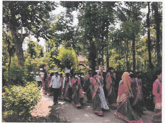
Jatha Moving in the Streets of Kowdalli, 27-03-2021