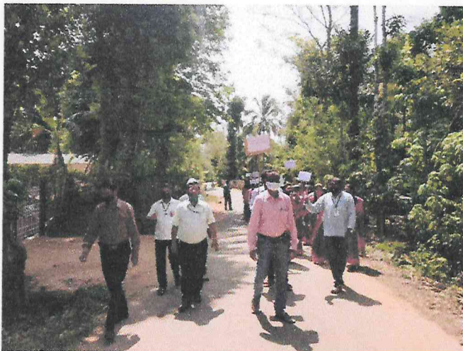
Jatha Moving in the Streets of Kowdalli, 27-03-2021