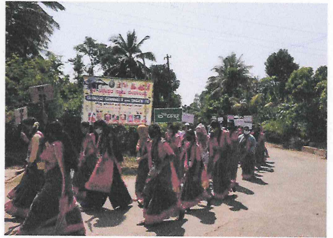
Jatha at the circle of Kowdalli, 27-03-2021