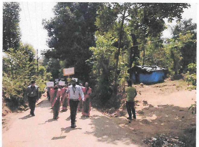
Jatha Moving in the Streets of Kowdalli, 27-03-2021